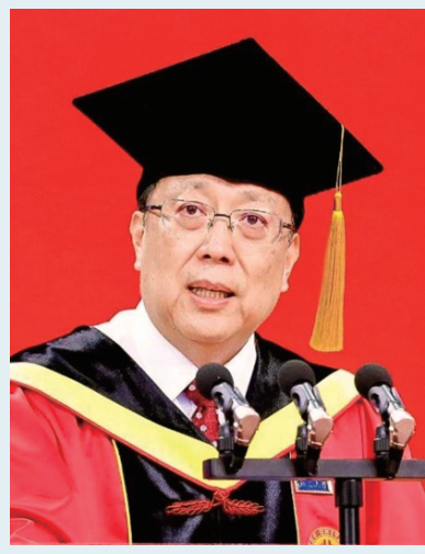
□ 郝平 (北京大学校长)

此次演练以实战化、操作化为原则,全程紧张有序,各部门分工明确、协调联动,行动有效、处置有力,演练内容突出真实性、科学性、规范性、操作性、安全性,是对学校前期各项筹备工作的全方位展示,通过演练,增强了学校处置突发事件的能力,明确了部门职责,熟悉了操作流程,为学生顺利、平安返校奠定了坚实基础。