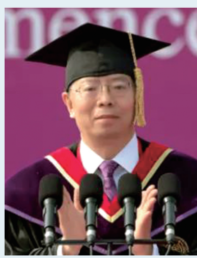
□ 邱勇 (清华大学校长)

2021年是值得你们铭记一生的年份,你们获得了第一个学位,为多彩的人生画卷增添了亮丽的一笔。2021年对中国来说更是一个永载史册的年份,困扰中华民族千百年来的绝对贫困问题得到历史性解决,全面建成小康社会取得伟大历史性成就。