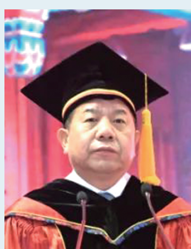
□ 林忠钦 (上海交通大学校长)

百年征程波澜壮阔,百年初心历久弥坚。回顾过往,我们可以看到,小到个人、团队,大到政党、国家,拥有坚定的信仰,才能不忘初心、矢志奋斗,才能不惧风浪、愈战愈勇。