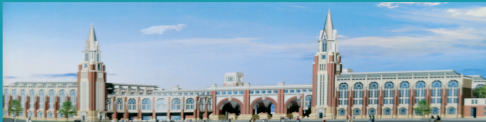
图为松江新校区教学大楼设计方案第四稿