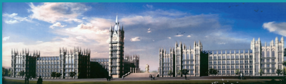
图为松江新校区教学大楼设计方案第二稿(仿英国剑桥大学版)