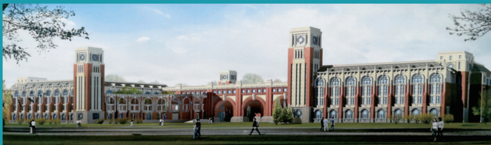
图为松江新校区教学大楼设计方案第五稿(最终定稿)