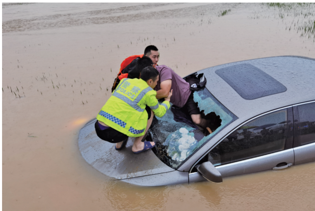
7月15日上午，四川省梓潼县遭遇强降雨袭击，县公安局立即启动应急预案，组织民警开展抢险工作。图为民警救助被洪水围困的群众。