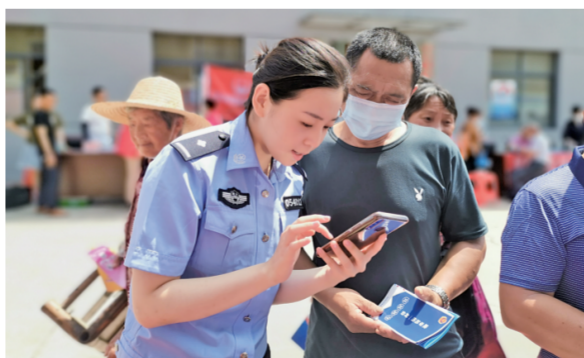
近日，湖北省荆州市公安局组织开展关爱“三留守”法治宣传进乡村活动，向群众开展防范电信网络诈骗宣传。