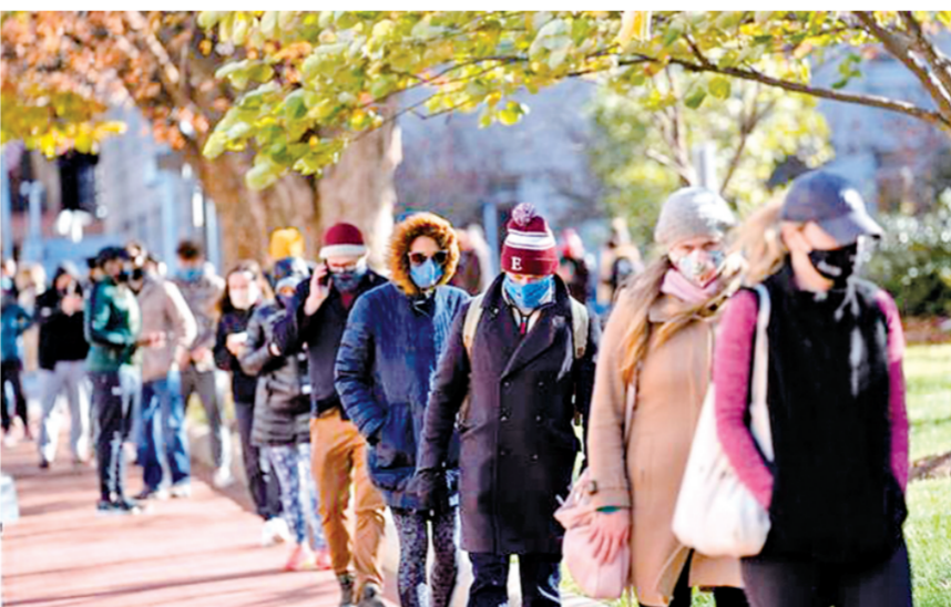
图为人们在美国华盛顿的一处新冠病毒检测点排队等候检测。