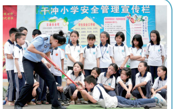
▲ 7月2日,在广西壮族自治区三江侗族自治县响洞镇干冲小学,江苏南京港出入境边防检查站支队民警向学生传授救生圈使用方法。