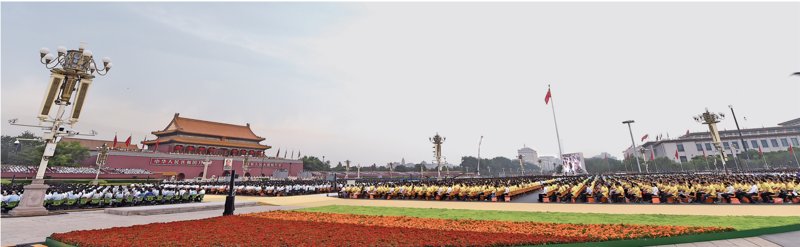
7月1日，庆祝中国共产党成立100周年大会在北京天安门广场隆重举行。图为大会现场。