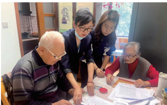
► 近期,陕西省西安市莲湖区公证处公证员利用午休时间,为腿脚不便的老人提供公证上门服务。