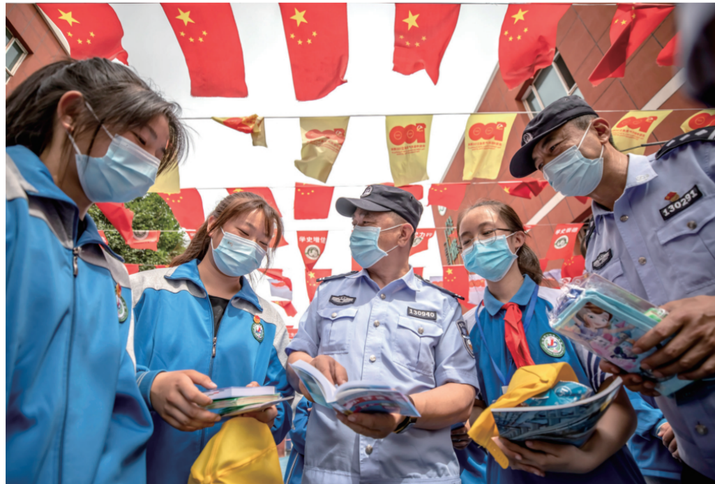
▲ 近日,乌鲁木齐铁路公安局乌鲁木齐公安处治安支队、东站派出所民警走进新疆生产建设兵团第十一师第一中学,向师生开展铁路安全法律知识宣讲活动。