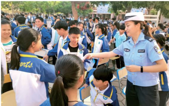
▲ 连日来,海南省东方市公安局交警在全市各中小学校内悬挂交通安全宣传横幅,发放宣传资料。