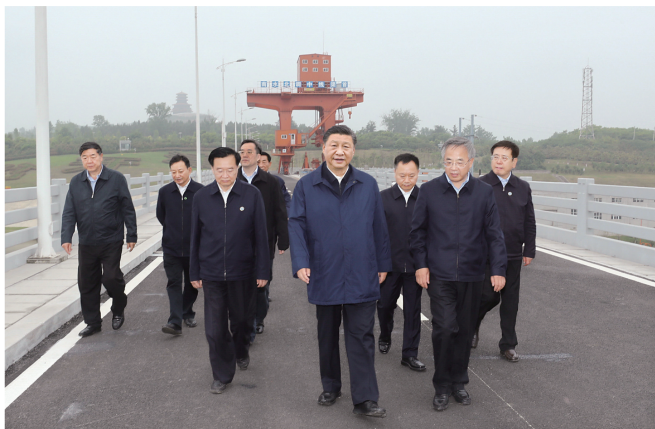
5月14日上午，中共中央总书记、国家主席、中央军委主席习近平在河南省南阳市主持召开推进南水北调后续工程高质量发展座谈会并发表重要讲话。这是座谈会前，习近平于13日在河南省南阳市淅川县陶岔渠首枢纽工程考察。