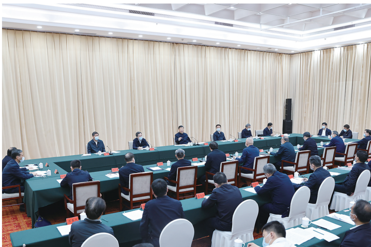
5月14日上午，中共中央总书记、国家主席、中央军委主席习近平在河南省南阳市主持召开推进南水北调后续工程高质量发展座谈会并发表重要讲话。