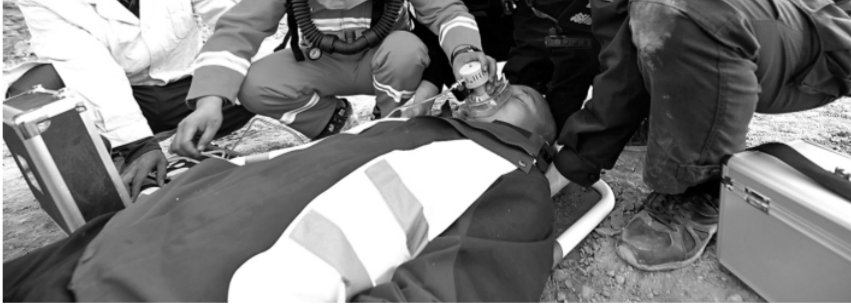
5月10日,新疆昌吉边境管理支队北山煤矿边境派出所针对对边境辖区企业进入生产高峰期这一实际,组织民警深入矿区联合矿企救援队开展矿区模拟塌方应急救援演练,切实提高矿企应急处置能力和警民协同救援能力。图为演练现场。

下一步,国家知识产权局将进一步完善知识产权保护中心规范化管理,充分发挥知识产权快速协同保护效能,服务区域产业知识产权全链条保护,更好地支撑经济高质量发展。