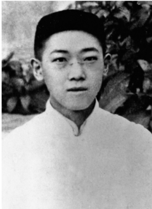
这是恽代英像(资料照片)。