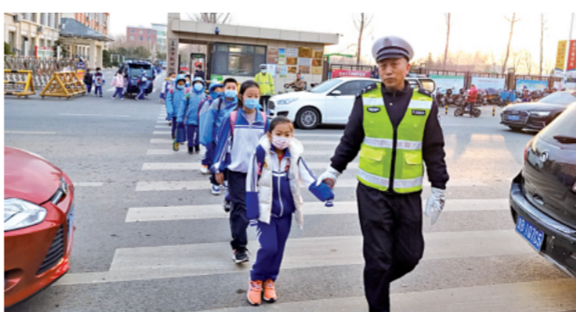
▲ 山东省莱西市公安局交警大队近日开展牵手平安活动,将党史学习教育与政法系统教育整顿相结合,与服务群众、为民办实事相结合。