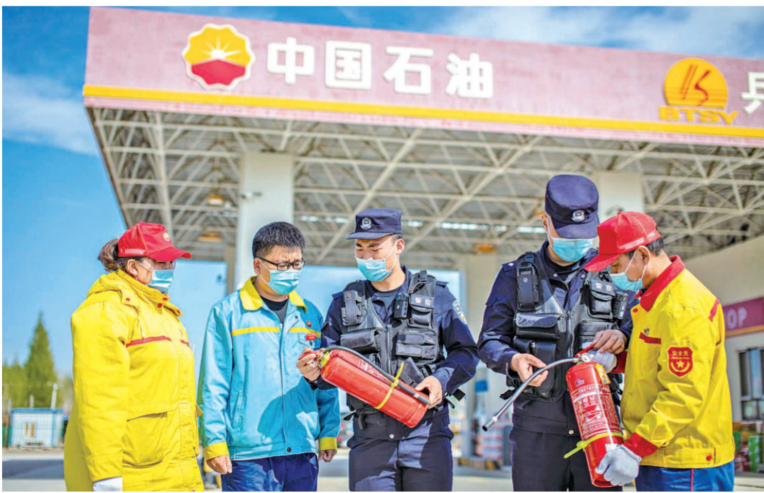
▲ 近日,新疆博州边境管理支队博乐边境管理大队霍尔果斯口岸派出所民警对辖区内企事业单位、人员密集场所的疫情防控、消防安全等进行全面检查,全力确保辖区社会治安形势良好。