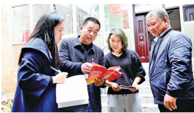
▲ 河南省汝阳县蔡店乡通过广播、微信等多种宣传渠道普及法律常识,做到“问题早发现、早化解、早处理”。图为蔡店乡司法所工作人员近日到妙西村一起邻里纠纷当事人家中回访。