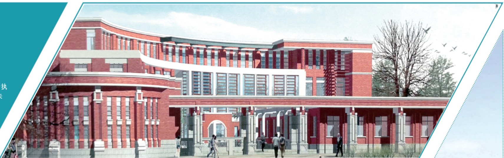
▲ 图为崇法楼建筑模型