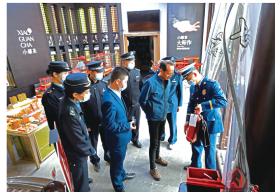
由公安、消防、市场监管等多部门组成的综合执法队对南湖景区内一家商超进行执法检查,排除安全隐患。