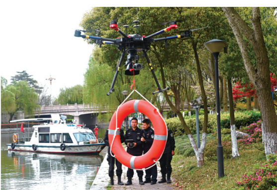
2020年,南湖区分局成立“警用无人机中队”,承担事件调查、救援搜索、交通监视等职责。