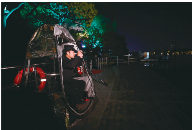
入夜,在湖心岛执勤点位上,一名辅警坐在防风小帐篷中利用夜视仪认真观察着湖面及水域周边情况。