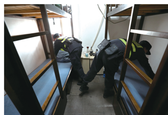
夜班值守结束后,民、辅警收拾整理好警室的内外准备下岛。