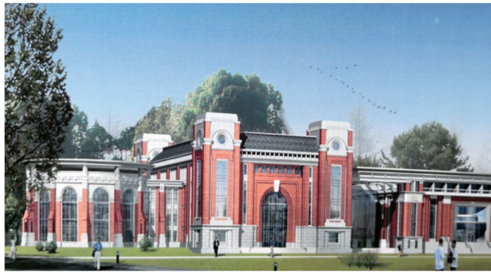
▲ 图为明德楼(校行政办公大楼)模型,右边是报告厅

“明法”之始。唐宋科举都有明法科。第三,表示明了法律知识,洞悉法的精髓,掌握法的技能。第四,宋时南诏大理段素英(昭明帝)年号。我们取了前三个含义,将教学大楼定名为“明法楼”。希望在这里学习的华政学子,首先要“明习法令”,明白为什么要建设法治;明白只有法治才是实现中华民族伟大复兴的必由之路。