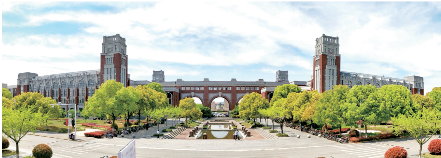
▲ 图为明法楼(教学大楼)全景实景图

对于上述这些问题的关注和解释,不只是为了满足笔者本人和读者的好奇心,也是帮助我们准确理解我国政法实践的需要。特别是对于法律人来说,如果不关心中国司法的政治结构和社会影响,也就不大可能透彻分析具体的司法问题。从这个意义上来说,还需要持续不断地、更为细致地研究最高人民法院的全部职能在国家政体中的重要作用和影响。