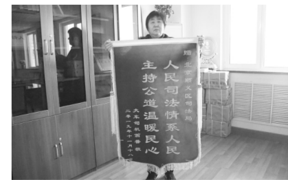
当事人向顺义区司法局赠送锦旗。