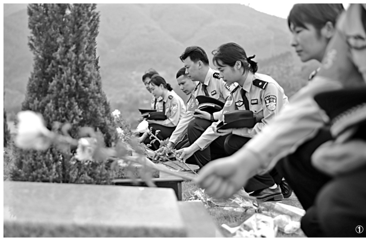
① 3月31日,广西壮族自治区贺州市公安局平桂分局组织青年民警到古柏山烈士陵园举行“继承先烈遗志 牢记初心使命”活动。图为民警向英烈献花。 ② 3月31日,海南省公安厅海岸警察总队第三支队组织民警到万宁六连岭革命纪念馆,开展“缅怀先烈·不忘初心”党史学习教育现场体验学习,图为民警在听党史讲解。 ③ 3月30日,新疆巴图克图出入境边防检查站民警来到塔城市烈士陵园,开展“缅怀革命先烈”清明祭奠活动。图为活动现场。 ④ 4月1日,湖北省襄阳市公安局在岷山烈士陵园举行祭奠公安英烈活动。图为民警代表向英烈献花。

贵州省司法厅党委书记、厅长张涛表示,为困难群众撑起一片法治蓝天,为受援群众提供优质高效法律服务,解决群众“急难愁”,让求助者满意而归,是法律援助的初心。下一步,贵州将继续强化法律援助,深化法治建设,为建设平安贵州、法治贵州提供有力保障。