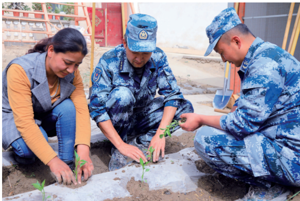
图为官兵到老乡庭院里帮他们种植农作物。