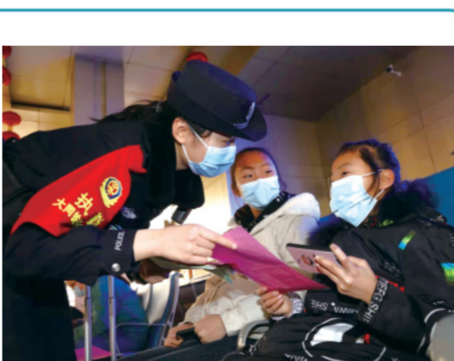
▲ 春运期间,大同铁路警方深入旅客群众中宣传讲解防疫知识,发放疫情防控小常识宣传资料。