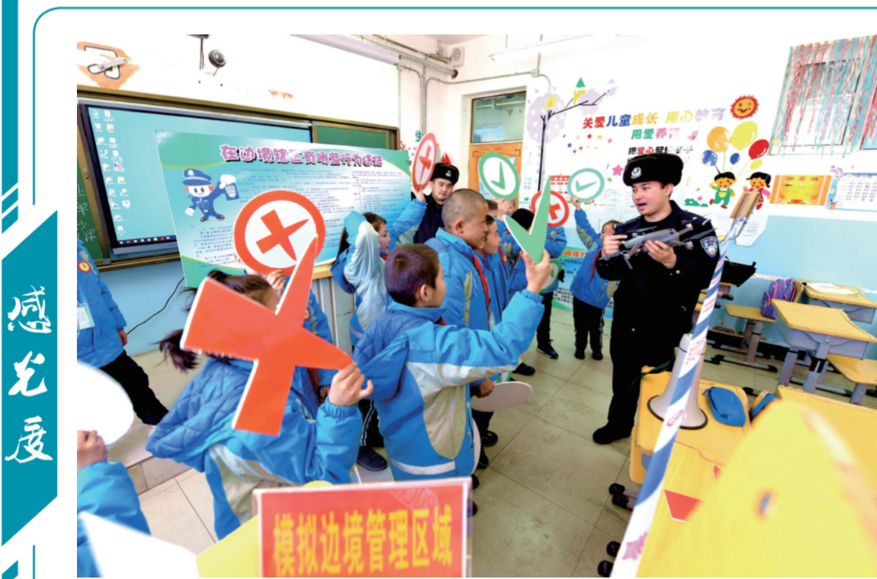
又到开学季,3月1日,新疆出入境边防检查总站吉边境管理支队库南边境派出所民警走进边境社区小学,向学生宣传讲解边境法律法规知识。

“法律是人们行为的基本底线。PUA行为一旦违法,应当受到法律的制裁,各行各业都应该在职业伦理中树立平等、尊重、保障人权的理念,另外应该加强教育,帮助人们识别PUA、防范PUA。”郑宁说。