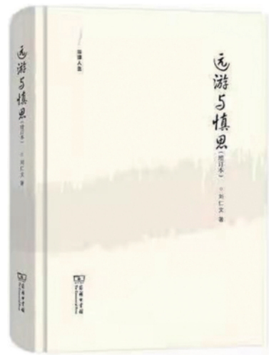
《远游与慎思》作者刘仁文, 商务印书馆2015年第一版, 2020年增订本