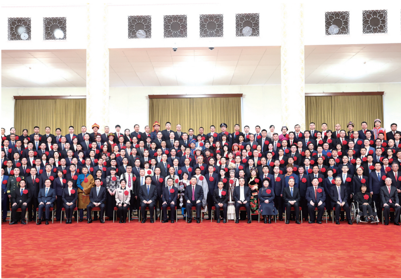
2月25日,全国脱贫攻坚总结表彰大会在北京人民大会堂隆重举行。会前,习近平等会见全国脱贫攻坚楷模荣誉称号获得者,全国脱贫攻坚先进个人、先进集体代表,全国脱贫攻坚楷模荣誉称号个人获得者和因公牺牲全国脱贫攻坚先进个人亲属代表等,并同大家合影留念。

新华社北京2月25日电 全国脱贫攻坚总结表彰大会25日上午在北京人民大会堂隆重举行。中共中央总书记、国家主席、中央军委主席习近平向全国脱贫攻坚楷模荣誉称号获得者等颁奖并发表重要讲话。习近平强调,经过全党全国各族人民共同努力,在迎来中国共产党成立一百周年的重要时刻,我国脱贫攻坚战取得了全面胜利,现行标准下9899万农村贫困人口全部脱贫,832个贫困县全部摘帽,128万个贫困村全部出列,区域性整体贫困得到解决,完成了消除绝对贫困的艰巨任务,创造了又一个彪炳史册的人间奇迹!这是中国人民的伟大光荣,是中国共产党的伟大光荣,是中华民族的伟大光荣。