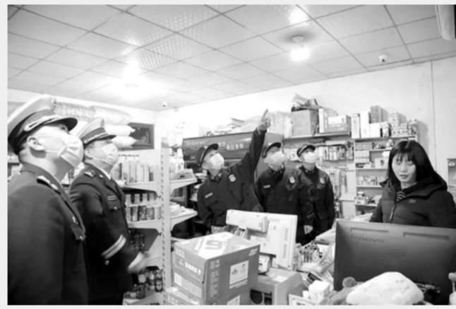
为确保春节期间消防安全,近日,陕西省消防救援总队队长徐伟保带队对西安市经开区大型商业综合体、沿街门店“九小场所”、老旧小区、仓储物流等单位进行消防安全检查,图为徐伟保(左三)带队检查沿街门店消防设施。

“十四五”期间,要以保护知识产权为核心,全面提升种业监管治理能力。“要加快推动修订植物新品种保护条例,建立实质性派生品种制度,鼓励自主创新,原始创新,提高品种权保护强度;建立知识产权跨部门跨区域联动保护和行政司法协同保护机制;强化品种审定登记事后监管,强化种业创新保护的正向激励和失信惩戒机制,实现打假维权全国联动、信用挂钩。要压实地方主体责任,构建以属地为主、部门协同、区域联动、社会参与的监管格局;要强化装备和经费保障,形成“行业管理+综合执法+行业协会”体系合力;加快建设种业大数据平台和重点作物DNA分子指纹数据库,规范品种命名,强化标准样品管理。