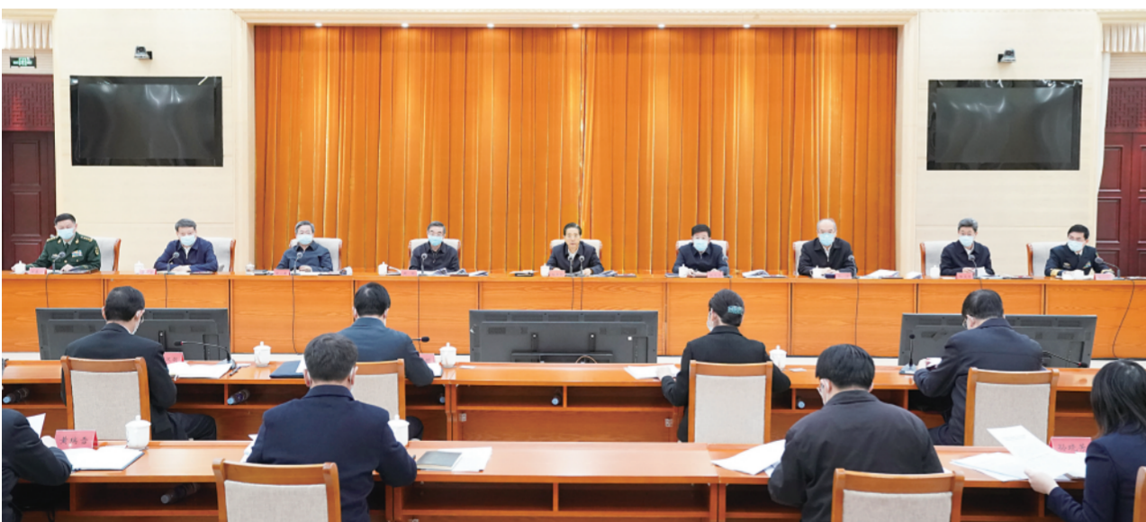
1月25日，中共中央政治局委员、中央政法委书记郭声琨主持召开中央政法委员会全体会议，学习贯彻习近平总书记重要讲话和十九届中央纪委五次全会精神。