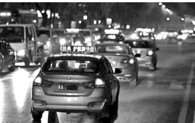
青海西宁出租车LED顶灯屏滚动显示“宣传普及民法典,护航新生活”等标语。