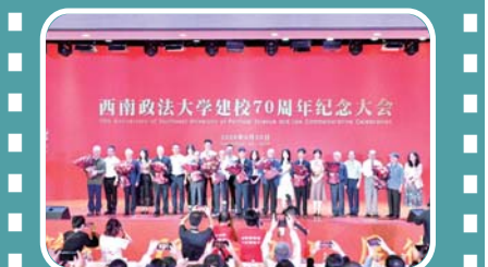
图为向老一辈教职工献花