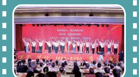
图为各地校友会代表舞会献旗 华龙网

肺炎疫情防控中起到了重大作用,得到了党和国家的高度肯定。回想起来,每当在攻克科技难题,遇到巨大压力时,“西政精神”底蕴一直激励着自己奋勇向前。