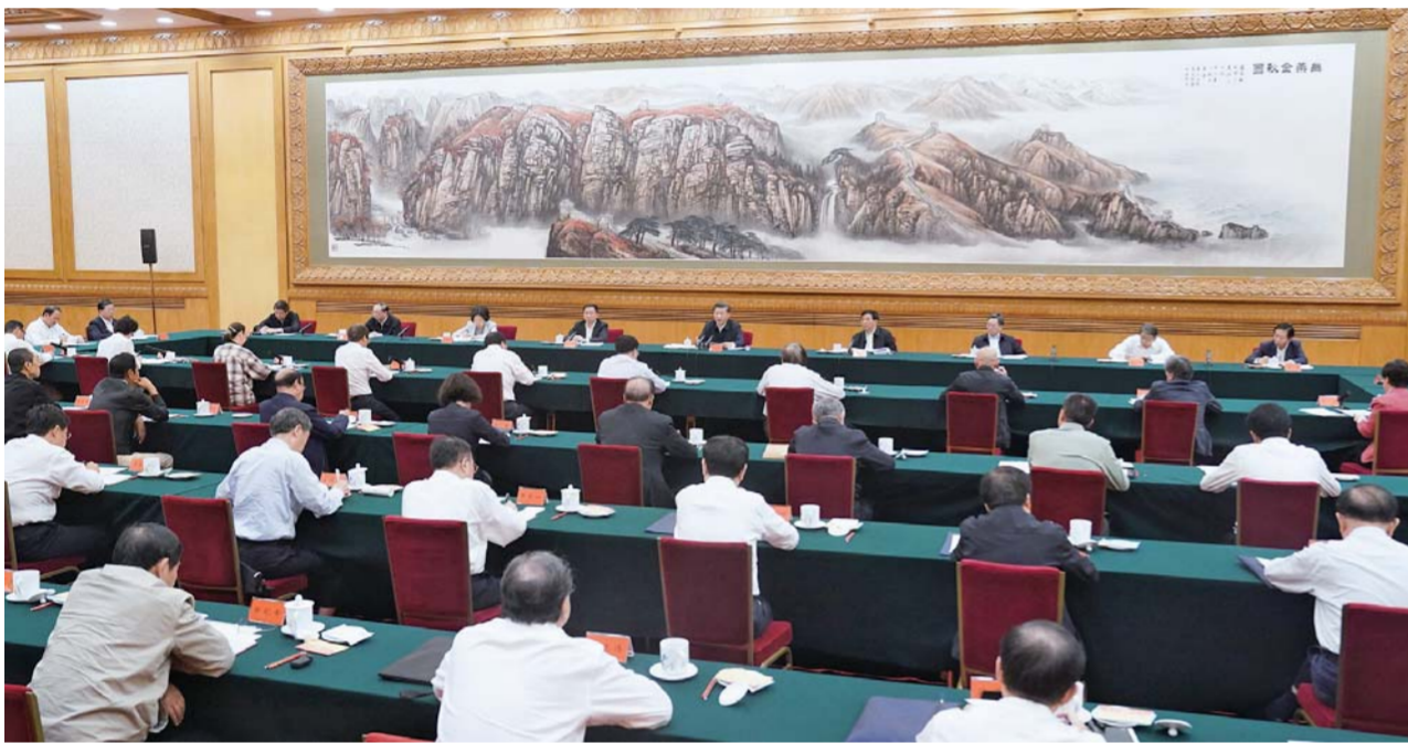
9月22日，中共中央总书记、国家主席、中央军委主席习近平在京主持召开教育文化卫生体育领域专家代表座谈会并发表重要讲话，就“十四五”时期经济社会发展听取意见和建议。