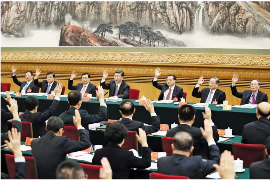
10月23日，中国共产党第十九次全国代表大会主席团在北京人民大会堂举行第四次全体会议。习近平、李克强、张德江、俞正声、刘云山、王岐山、张高丽等出席会议。

新华社北京10月23日电 中国共产党第十九次全国代表大会主席团22日晚和23日上午在人民大会堂举行第三次和第四次全体会议，通过十九届中央委员会委员、候补委员和中央纪委检查委员会委员候选人名单(草案)，提交各代表团酝酿。