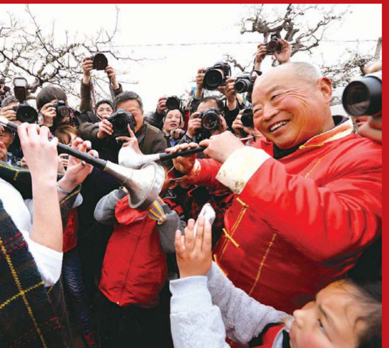
(作者单位:安徽省宿州市埇桥区人民法院)

抓法治、一手抓德治，既重视发挥法律的规范作用，又重视发挥道德的教化作用，实现法律与道德相辅相成，法治和德治相得益彰。 2015年10月，在文艺工作座谈会上，习近平总书记强调“文艺不能在市场经济大潮中迷失方向”“通过更多有筋骨、有道德、有温度的文艺作品，书写和记录人民的伟大实践，时代的进步要求，彰显信仰之美、崇高之美”。这些理念正是让人从内心树立起善恶、美丑观念，在全社会形成正确价值观和良好秩序的“礼乐之法”。